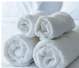
ベッドなどの 身の周りに

必要なのは、「水道水」だけ。薬剤など一切使用しないので安心。 テーブルや、ドアノブなど気になる箇所に吹き付けてご使用ください。 様々な用途で、いつでも、どこでも瞬時にご利用頂けます。