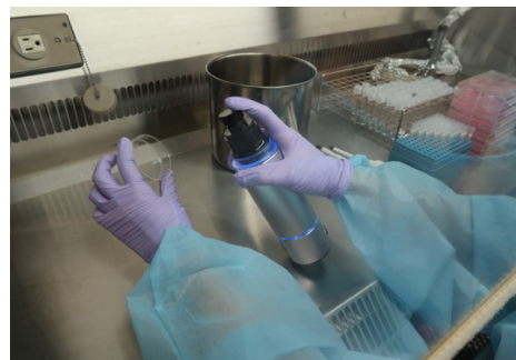
図1. 新型コロナウイルスを塗抹させたシャーレにオゾン水の噴霧