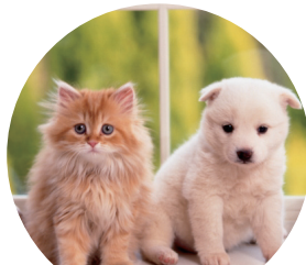
ペット 身の周り用品